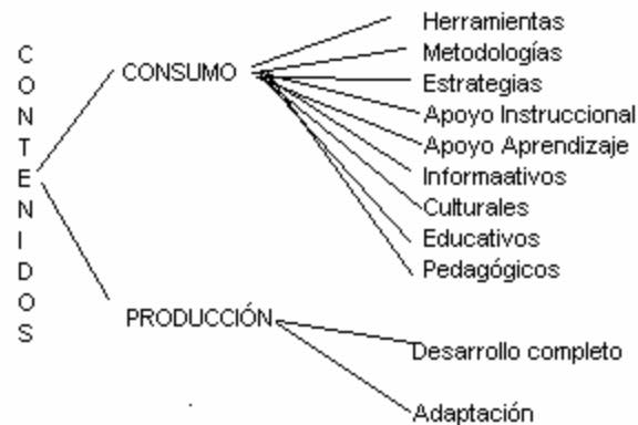
Fig. 2. Tipos de contenidos

La figura 2 hace una clasificación general de los diversos tipos de contenidos en función de su consumo y producción.